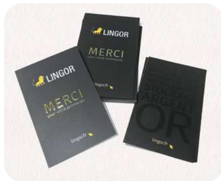
Vernis 3D et OR pour un client brillant.