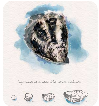
Dessin personnalisé, imprimé sur papier de création et numéroté, pour un effet aquarelle.