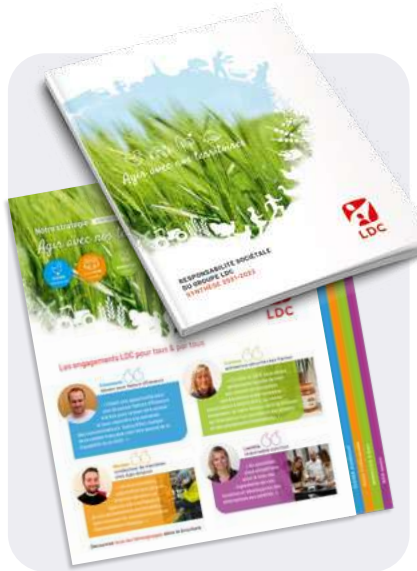
Des plis décalés pour plus de praticité.