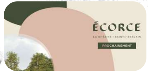
Bannière web pour l'annonce d'un programme immobilier.