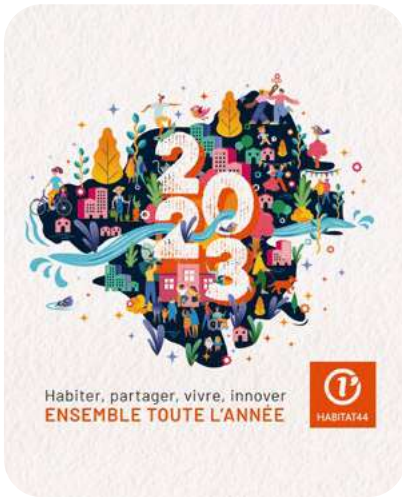
Carte de vœux illustrée... Tout le département s'anime.