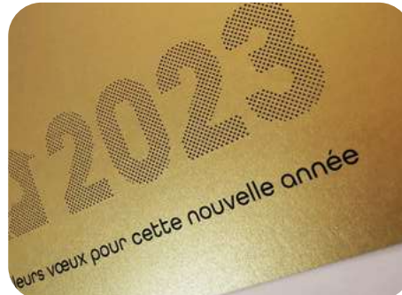
Tout est dans le détail ! Papier de création doré et micro-perforation... Pour un rendu délicat et élégant.